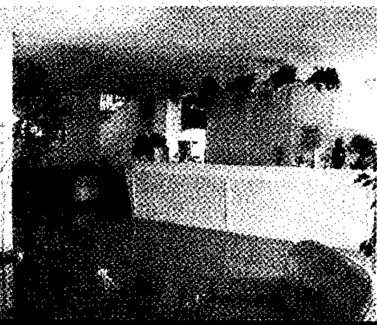
UNAWAY Hotel Montepulciano Ovest - A1

L'ambizioso progetto prevede la realizzazione, lungo i tratti autostradali A1, A4 e A14, di 11 nuovi hotel firmati Giugiaro Architettura