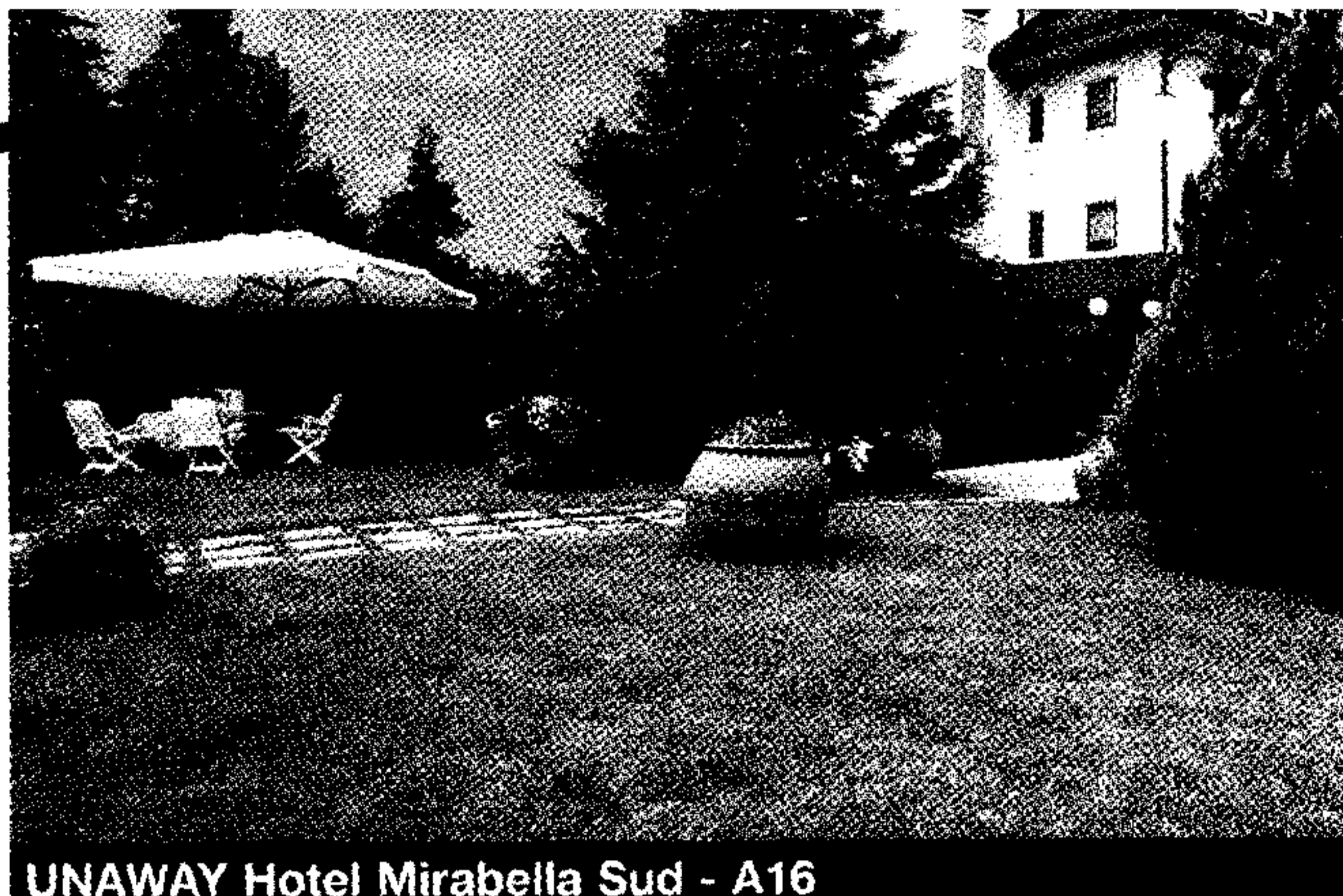
UNAWAY Hotel Mirabella Sud - A16

Rivoluzionare il modo di viaggiare e, insieme, di sostare, non è cosa da poco. Ci provano gli UNAWAY Hotels, 11 strutture su progetto esclusivo di Giugiaro, più alcuni hotel già affiliati in franchising situati lungo le aree di servizio delle autostrade. Oasi rigeneranti e attrezzati business corner, unici nel loro genere