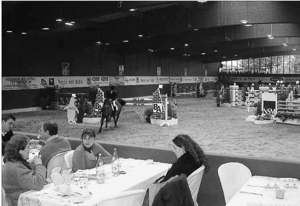
IL MANEGGIO ALL'EX GESE