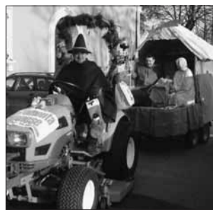
LA "CAPANNA ITINERANTE"