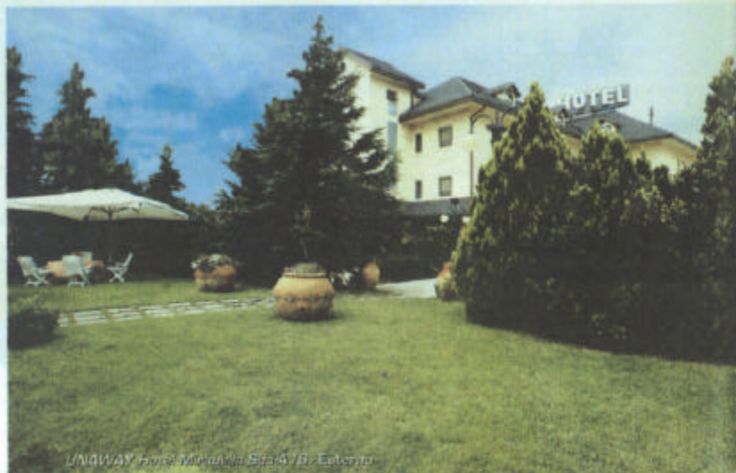
UNAWAY Hotel Modulo in Strada 10 - Calenzano

preciso obiettivo di realizzare una struttura modulare , che si adatti facilmente agli spazi disponibili nelle aree di servizio, che risponda alla naturale esigenza di realizzare delle economie di scala, e che sia al contempo caratterizzata da un tratto fortemente riconoscibile e da elevati standard qualitativi , sia in termini di design che di materiali. In particolare, gli edifici si contraddistinguono per la presenza di un segno geometrico semplice, ma al tempo stesso molto caratterizzante: un portale ideale che, avvolgendo il volume