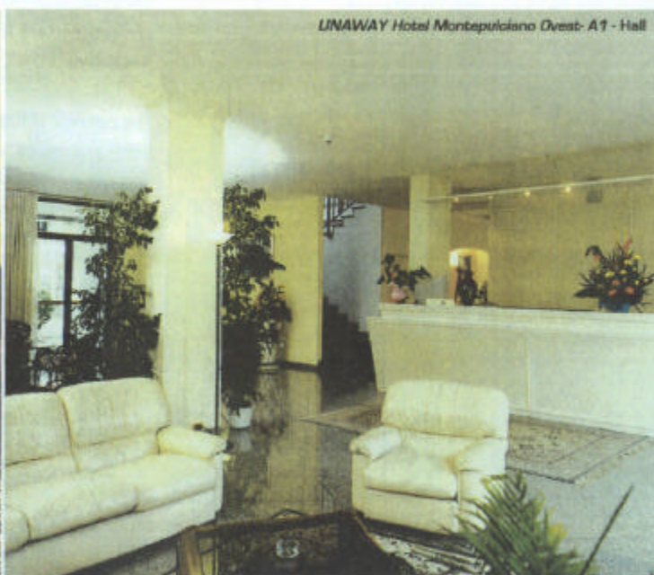
UNAWAY Hotel Montepulciano Ovest-A1 - Hall