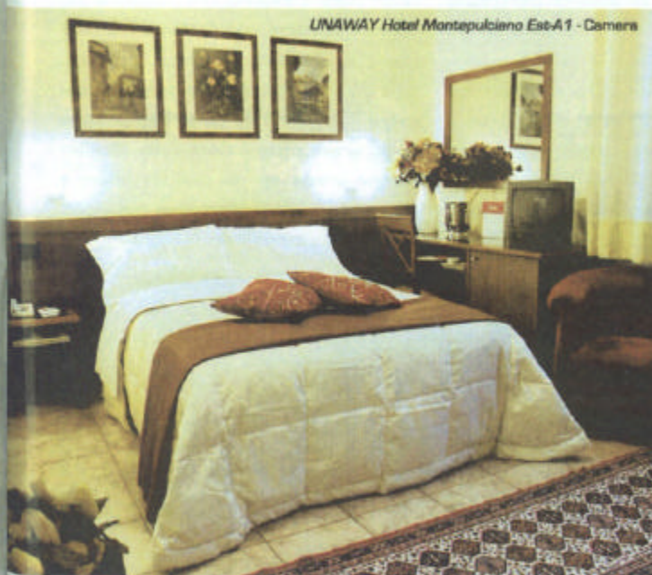
UNAWAY Hotel Montepulciano Est-A1 - Camera

re che possano essere un funzionale punto d'incontro per meeting di lavoro , così come il luogo ideale per la sosta della famiglia durante un lungo viaggio; un'oasi di riposo per il motociclista solitario, così come pure un punto di riferimento sicuro per il gruppo di amici di ritorno da lunghe serate di divertimento. Un aspetto, quest'ultimo, che può rappresentare una prima soluzione concreta anche alle sempre più frequenti preoccupazioni espresse dalle Autorità in termini di sicurezza stradale. ■