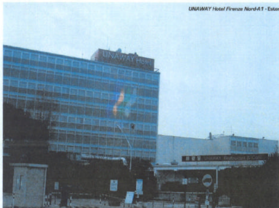
UNAWAY Hotel Firenze Nord-A1 - Estero

Oltre a questi primi tre accordi, UNA Hotels & Resorts ha registrato, infatti, molte manifestazioni di interesse da parte di strutture indi-